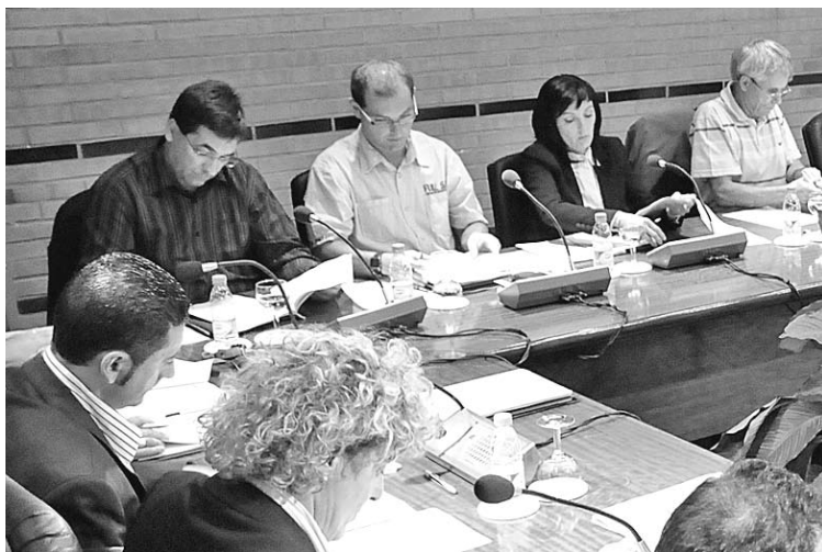
BUSCANT SOLUCIONS. La regidora estudia incorporar més personal a l'àrea A. MATEOS

■ La crisi econòmica i el conseqüent increment de l'atur a Roses -la setmana passada es situa entorn dels 1.300 parats- s'està acarnissant amb la classe mitjana, una franja de la societat que no acostumava a necessitar l'ajuda dels serveis socials. Això ha fet disparar la demanda de l'Àrea de Benestar de l'Ajuntament de Roses, que calcula que es situa aproximadament al doble de la d'ara fa un any: han passat d'una vintena de sol·licituds o consultes setmanals a una quarantena.